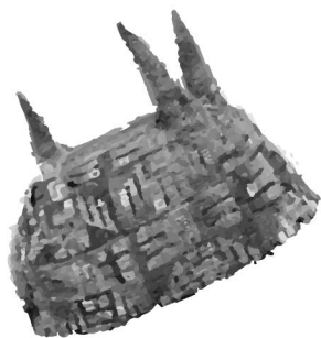
Gorro de cuatro puntas Cultura Tiwanaku

Puedes buscar más piezas en www.mapi.uy/inventario