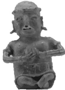
Escultura antropomorfa Cultura Nayarit