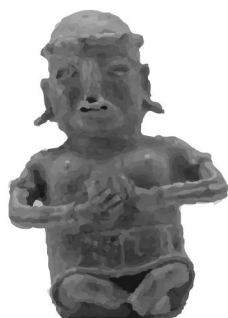
Escultura antropomorfa Cultura Nayarit