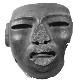
Máscara Funeraria de Jade Área mesoamericana