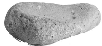
Mortero de piedra Cuenca del PLata

Compartinos tu creación a: educacion@mapi.uy