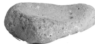
Mortero de piedra Cuenca del PLata

Compartinos tu creación a: educacion@mapi.uy