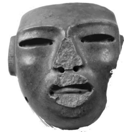
Máscara Funeraria de Jade Área mesoamericana