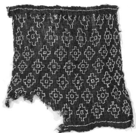
Manto textil funerario Área Andina